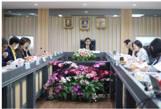
ภาพการประชุมเพื่อจัดทำคู่มือการดำเนินการได้มาซึ่ง อ.ก.ค.ศ. เขตพื้นที่การศึกษา ปี พ.ศ. ๒๕๖๗ ณ ห้องประชุมจรรยา มิลินทร์ สำนักงาน ก.ค.ศ. กระทรวงศึกษาธิการ