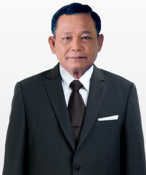
รัฐมนตรีว่าการกระทรวงศึกษาธิการ (พลเอก ดาว์พงษ์ รัตนสุวรรณ)