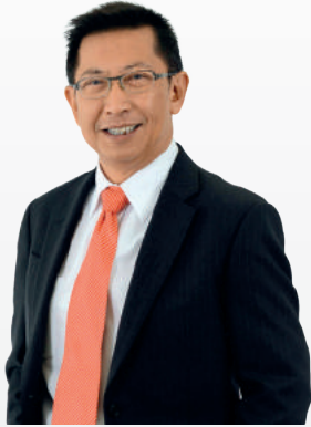
ปลัดกระทรวงการท่องเที่ยวและกีฬา (นายอาร์พงศ์ กุชอุ่ม)