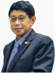
ผู้ทรงคุณวุฒิด้านกฎหมาย (ศาสตราจารย์กิตติคุณ วิษณุ เครืองาม)