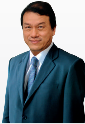
ปลัดกระทรวงวัฒนธรรม (ศาสตราจารย์ อนันต์ ไพทยานนท์)