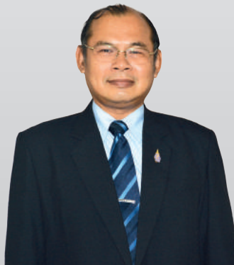
เลขาธิการคุรุสภา (นายชัยศ อัมสุวรรณ)