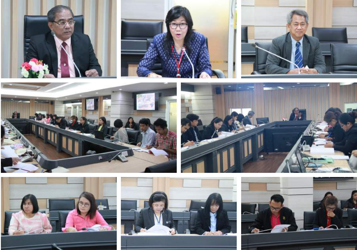
การประชุมเชิงปฏิบัติการกำกับ ติดตามผลการปฏิบัติราชการและจัดทำรายงานผลการดำเนินงานตามคำรับรอง การปฏิบัติราชการและจัดทำรายงานผลการดำเนินงานตามคำรับรองการปฏิบัติราชการ ของสำนักงาน ก.ค.ศ. ประจำปีงบประมาณ พ.ศ. 2559 รอบ 12 เดือน ณ ห้องประชุมจตุรภู มิลินทร์ อาคารรัชมังคลาภิเษก กระทรวงศึกษาธิการ เมื่อวันที่ 22 กันยายน 2559