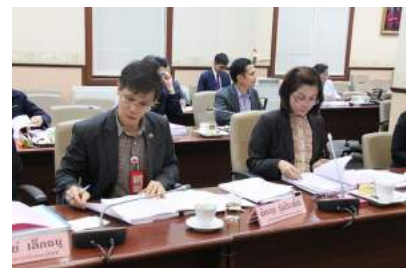
ประชุมคณะกรรมการแก้ไขปัญหาหนี้สินครู ครั้งที่ 2/2558 ณ ห้องประชุมราชวัลลภ อาคารราชวัลลภ กระทรวงศึกษาธิการ เมื่อวันที่ 20 พฤศจิกายน 2558