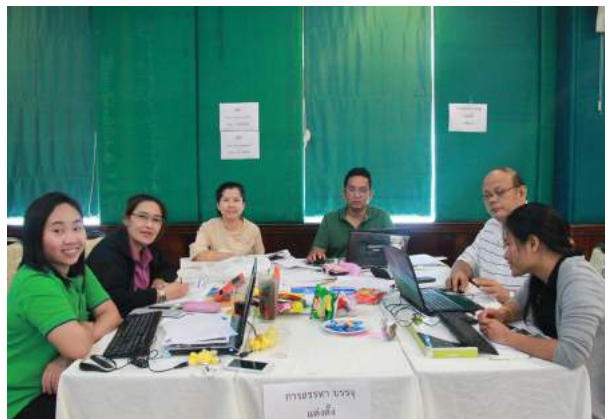
การประชุมเชิงปฏิบัติการจัดทำคู่มือการบริหารงานบุคคลข้าราชการครูและบุคลากรทางการศึกษาของ กศจ. ณ โรงแรมอิงธาร รีสอร์ท จังหวัดนครนายก เมื่อวันที่ 25 - 27 มีนาคม 2559