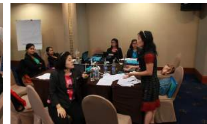
การประชุมเชิงปฏิบัติการการวัดผลระบบควบคุมภายใน ณ โรงแรมเดอะทิวรี่ ทาวเวอร์ กรุงเทพมหานคร เมื่อวันที่ 8 - 10 กันยายน 2559