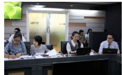
การประชุมเชิงปฏิบัติการเพื่อพิจารณา (ร่าง) แผนยุทธศาสตร์พัฒนาการบริหารงานบุคคลของข้าราชการครูและบุคลากรทางการศึกษา พ.ศ. 2560 - 2563 และจัดทำแผนปฏิบัติราชการประจำปีงบประมาณ พ.ศ. 2560 ของสำนักงาน ก.ค.ศ. ณ ห้องประชุมจรรยา มิลินทร์ ชั้น 7 อาคารรัชมังคลาภิเษก สำนักงาน ก.ค.ศ. เมื่อวันที่ 28 - 29 กันยายน 2559