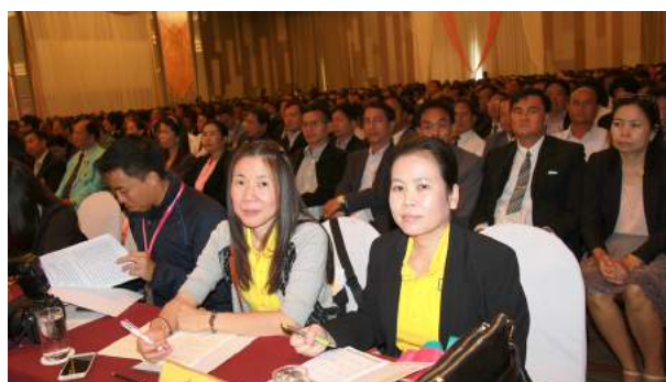
ประชุมสัมมนาการบริหารงานบุคคลของข้าราชการครูและบุคลากรทางการศึกษา ในคณะกรรมการศึกษาธิการจังหวัด (กศจ.) ภาคตะวันออกเฉียงเหนือ ณ โรงแรมพูลแมน ขอนแก่นราชา ออคิด จังหวัดขอนแก่น เมื่อวันที่ 18 - 19 มิถุนายน 2559