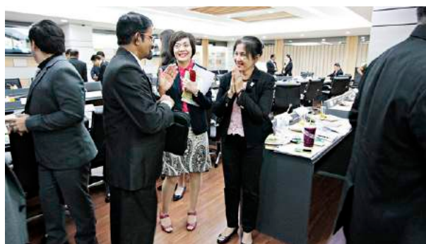
สำนักงาน ก.ค.ศ. ให้การต้อนรับคณะเจ้าหน้าที่จาก Central Province of Sri Lanka กระทรวงศึกษาธิการศรีลังกา ห้องประชุมจตุรรม มิวสิคฮอลล์ เมื่อวันที่ 24 พฤศจิกายน 2558