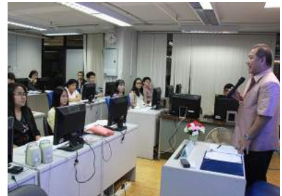
การประชุมเชิงปฏิบัติการจัดการความรู้ องค์ความรู้ที่ 7 เรื่องเทคนิคการสืบค้นฐานข้อมูลหนังสือเวียนของสำนักงาน ก.ค.ศ. ณ ห้องประชุมฝึกอบรมคอมพิวเตอร์ 2 ชั้น 4 ศูนย์เทคโนโลยีสารสนเทศและการสื่อสาร เมื่อวันที่ 21 มิถุนายน 2559