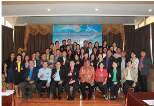
การประชุมเชิงปฏิบัติการเพื่อปรับปรุงมาตรฐานตำแหน่งและมาตรฐานวิทยฐานะของข้าราชการครูและบุคลากรทางการศึกษา ณ โรงแรมชาวลัน รีสอร์ท จังหวัดนครปฐม เมื่อวันที่ 28 กุมภาพันธ์ - 1 มีนาคม 2559