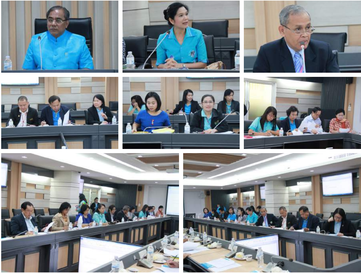
การพัฒนาหลักเกณฑ์และวิธีการสรรหาข้าราชการครูและบุคลากรทางการศึกษา เมื่อวันที่ 11 สิงหาคม 2559