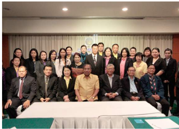
การประชุมเชิงปฏิบัติการเพื่อตรวจสอบ กลั่นกรอง วิเคราะห์ หาแนวทางแก้ไข กรณีที่ดำเนินการไม่ถูกต้องตามหลักเกณฑ์ และวิธีการที่ ก.ค.ศ. กำหนดของบุคลากรทางการศึกษาอื่นตามมาตรา 38 ค. (2) เมื่อวันที่ 13 - 17 ธันวาคม 2558