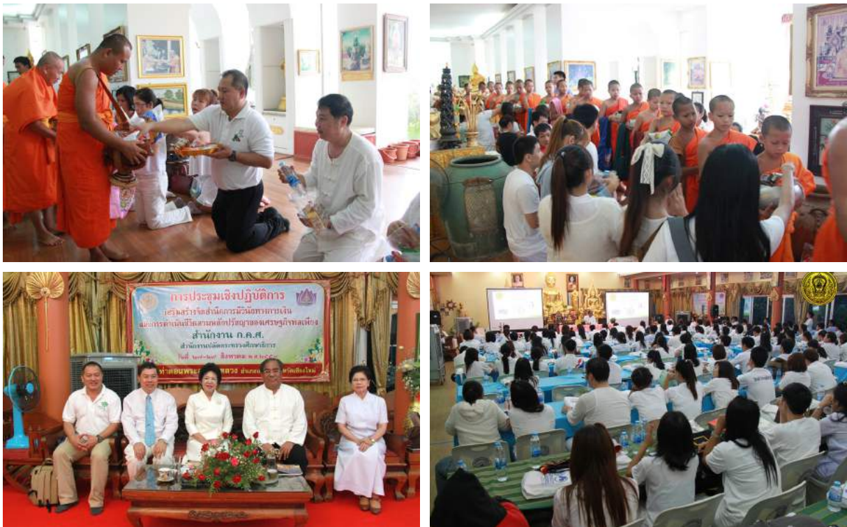
การประชุมเชิงปฏิบัติการเสริมสร้างจิตสำนึกการมีวินัยทางการเงินและการดำเนินชีวิตตามหลักปรัชญาเศรษฐกิจพอเพียง ณ เมื่อวันที่ 27 - 29 สิงหาคม 2559