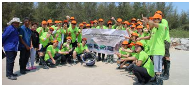
กิจกรรมส่งเสริมการดำเนินชีวิตตามแนวเศรษฐกิจพอเพียง สำนักงาน ก.ค.ศ. ณ ศูนย์ศึกษาการพัฒนาห้วยทรายอันเนื่องมาจากพระราชดำริ อุทยานสิ่งแวดล้อมนานาชาติสิรินธร และพระราชนิเวศน์มฤคทายวัน อำเภอชะอำ จังหวัดเพชรบุรี เมื่อวันที่ 4 - 5 มีนาคม 2559