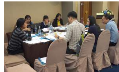
การประชุมเชิงปฏิบัติการจัดทำรายละเอียดและขั้นตอนกระบวนการสนับสนุนของสำนักงาน ก.ค.ศ. ประจำปีงบประมาณ พ.ศ. 2559 ณ โรงแรมเดอะทวิน ทาวเวอร์ กรุงเทพมหานคร เมื่อวันที่ 11 - 13 กันยายน 2559