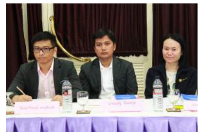
การประชุมเชิงปฏิบัติการจัดทำคู่มือปฏิบัติงานการออกคำสั่งเลื่อนขั้นเงินเดือนและการปรับเงินเดือนตามคุณวุฒิ ของข้าราชการครูและบุคลากรทางการศึกษา ณ โรงแรมบัดดี้ โอเรียนทอล ริเวอร์ไซด์ อำเภอปากเกร็ด จังหวัดนนทบุรี เมื่อวันที่ 14 - 16 กุมภาพันธ์ 2559