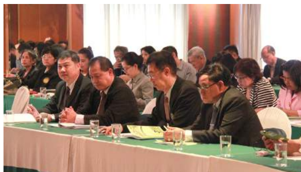
การประชุมชี้แจงการบริหารงานบุคคลสำหรับข้าราชการครูและบุคลากรทางการศึกษาของ กศจ. ณ โรงแรมรอยัล ริเวอร์ กรุงเทพมหานคร เมื่อวันที่ 9 เมษายน 2559