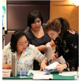
การประชุมเชิงปฏิบัติการการปรับปรุงหลักเกณฑ์และวิธีการให้ข้าราชการครูได้รับเงินเดือน และ/หรือปรับปรุงการกำหนดตำแหน่งเลื่อนและแต่งตั้งให้ดำรงตำแหน่งในกรณีที่ได้รับคุณวุฒิเพิ่มขึ้น ณ โรงแรมรอยัลริเวอร์ กรุงเทพฯ เมื่อวันที่ 23 - 25 กันยายน 2559