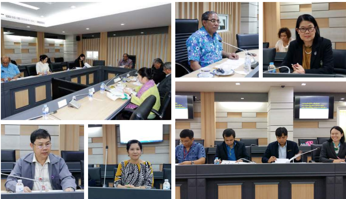
การประชุมเชิงปฏิบัติการเพื่อปรับปรุง(ร่าง)เกณฑ์มาตรฐานอัตรากำลังในสถานศึกษาระดับการศึกษาขั้นพื้นฐาน สังกัดกระทรวงศึกษาธิการ ณ ห้องประชุมจตุรภู มิลินทร์ อาคารรัชมังคลาภิเษก สำนักงาน ก.ค.ศ. กระทรวงศึกษาธิการ เมื่อวันที่ 23 - 25 กันยายน 2559