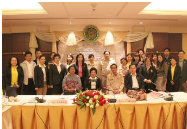
การประชุมเชิงปฏิบัติการ “ปรับปรุงแนวทางและขั้นตอนการรับชำระหนี้ และติดตามหนี้เงินกู้ยืมเงินทุนหมุนเวียน เพื่อแก้ไขปัญหาหนี้สินข้าราชการครู” ณ โรงแรมปรีนซ์พาเลซ กรุงเทพมหานคร เมื่อวันที่ 21 - 22 ธันวาคม 2558