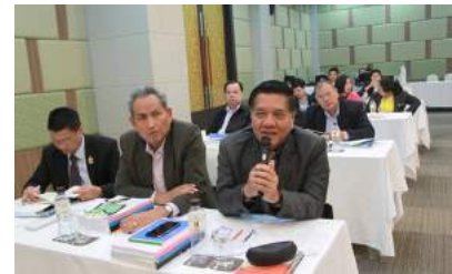
การประชุมเชิงปฏิบัติการจัดทำ (ร่าง) หลักเกณฑ์และวิธีการเกี่ยวกับการบริหารงานบุคคลของตำแหน่งบุคลากรทางการศึกษาอื่นตามมาตรา 38 ค. (2) ณ โรงแรมแกรนด์ราชาพลาซ่า จังหวัดนนทบุรี เมื่อวันที่ 11 - 13 กันยายน 2559