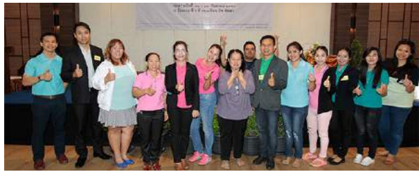
การประชุมเชิงปฏิบัติการเสริมสร้างประสิทธิภาพการปฏิบัติงานการเงินและบัญชีเงินทุนหมุนเวียนเพื่อแก้ไขปัญหาหนี้สินครู ณ โรงแรมดิวารี จอมเทียน บีช พัทยา จังหวัดชลบุรี เมื่อวันที่ 11 - 13 กันยายน 2559