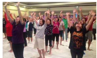
กิจกรรมเสริมสร้างสุขภาพบุคลากร สำนักงาน ก.ค.ศ. เพื่อประสิทธิภาพในการปฏิบัติงาน รุ่นที่ 2 ณ เดอะเลกาซี ริเวอร์แคว รีสอร์ท จังหวัดกาญจนบุรี เมื่อวันที่ 1 - 3 กรกฎาคม 2559