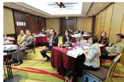
การประชุมเชิงปฏิบัติการจัดทำคู่มือปฏิบัติงานการออกคำสั่งบรรจุและแต่งตั้งข้าราชการครูและบุคลากรทางการศึกษา ณ โรงแรมริชมอนด์สไตลชีคอนเวนชั่น ไฮเทล จังหวัดนนทบุรี เมื่อวันที่ 20 - 22 มีนาคม 2559