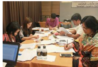
การจัดทำคู่มือการบริหารงานบุคคลของข้าราชการครูและบุคลากรทางการศึกษา ณ โรงแรมไมด้า งามวงศ์วาน จังหวัดนนทบุรี เมื่อวันที่ 6 - 8 มีนาคม 2559