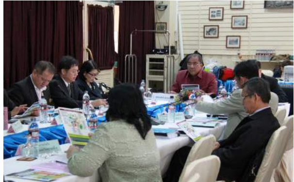
การประชุมเชิงปฏิบัติการเพื่อจัดทำรายละเอียดตัวชี้วัดของศึกษานิเทศก์จังหวัดศึกษานิเทศก์ภาคและคณะกรรมการศึกษานิเทศก์จังหวัด (กศจ.) ณ โรงแรมบัดดีโอเรียลทอล ริเวอร์ไซด์ จังหวัดนนทบุรี เมื่อวันที่ 21 - 22 กรกฎาคม 2559