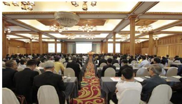
การประชุมสัมมนาการบริหารงานบุคคลของข้าราชการครูและบุคลากรทางการศึกษาในคณะกรรมการศึกษาธิการจังหวัด (กศจ.) ภาคเหนือ ณ โรงแรมคุ้มภูคำ จังหวัดเชียงใหม่ เมื่อวันที่ 28 - 29 พฤษภาคม 2559