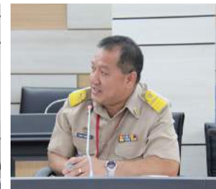
ประชุมเชิงปฏิบัติการจัดทำแผนปฏิบัติราชการของสำนักงาน ก.ค.ศ. ประจำปีงบประมาณ พ.ศ. 2559 เมื่อวันที่ 12 - 14 ตุลาคม 2558