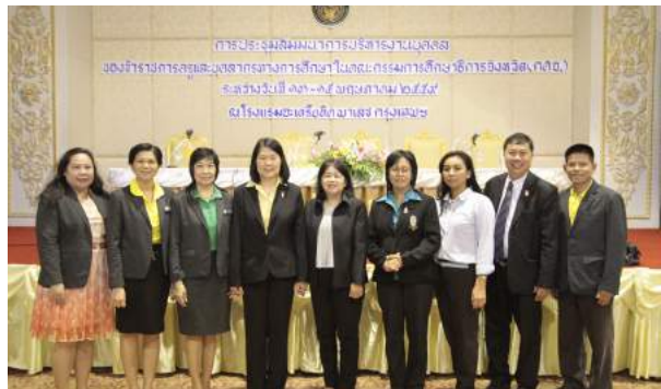
การประชุมสัมมนาการบริหารงานบุคคลของข้าราชการครูและบุคลากรทางการศึกษาในคณะกรรมการการศึกษาธิการจังหวัด (กศจ.) ณ โรงแรมอะเดรียทิด พาเลซ กรุงเทพมหานคร เมื่อวันที่ 13 - 15 พฤษภาคม 2559