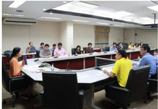
การจัดการองค์ความรู้ในองค์กร ณ สำนักงาน ก.ค.ศ. เมื่อวันที่ 14 กรกฎาคม 2559