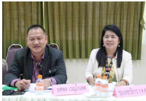
ประชุมเชิงปฏิบัติการเพื่อจัดทำ (ร่าง) กฎ ก.ค.ศ. ว่าด้วยการเลื่อนขั้นเงินเดือนของข้าราชการครูและบุคลากรทางการศึกษา พ.ศ. .... ณ โรงแรมบ้านปลาทับทิม แม่กลอง รีสอร์ท จังหวัดสมุทรสงคราม เมื่อวันที่ 13 - 15 ธันวาคม 2558