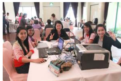
การประชุมเชิงปฏิบัติการจัดทำคู่มือการบริหารงานบุคคลสำหรับข้าราชการครูและบุคลากรทางการศึกษาของ กศจ. ณ โรงแรมบัดดี้ ริเวอร์ไซด์ โอเรียลทอล จังหวัดนนทบุรี เมื่อวันที่ 2 - 3 เมษายน 2559