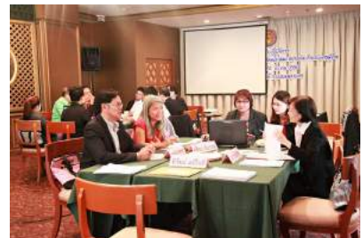
การประชุมเชิงปฏิบัติการจัดทำแบบประเมินการเตรียมความพร้อม และพัฒนาอย่างเข้มแก่ข้าราชการครูและบุคลากรทางการศึกษา ณ โรงแรมรอยัลซิติ้ กรุงเทพมหานคร เมื่อวันที่ 22 - 24 มีนาคม 2559