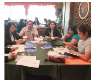
การประชุมเชิงปฏิบัติการจัดทำคู่มือการวิเคราะห์คำขอเกี่ยวกับการบริหารงานบุคคลของข้าราชการครูและบุคลากรทางการศึกษา ณ โรงแรมรอยัลซิดี กรุงเทพมหานคร เมื่อวันที่ 9 - 12 มีนาคม 2559