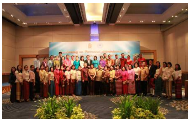
การประชุมอาเซียนเพื่อการบริหารงานบุคคลของข้าราชการครูและบุคลากรทางการศึกษา (The Meeting on Personnel Administration of Teachers and Educational Personnel in ASEAN) เมื่อวันที่ 27 - 29 กรกฎาคม 2559 ณ โรงแรมรอยัล ออร์คิด เซอราตัน กรุงเทพมหานคร