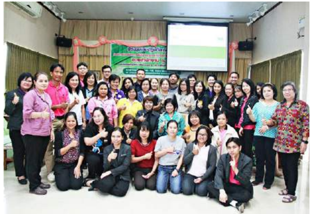
ประชุมเชิงปฏิบัติการชี้แจงกรอบการประเมินผลการปฏิบัติราชการตามคำรับรองการปฏิบัติราชการระดับสำนัก ของสำนักงาน ก.ค.ศ. และทบทวนการวิเคราะห์กระบวนการ ประจำปีงบประมาณ พ.ศ. 2559 ณ บ้านปลาทับทิม แม่กลอง รีสอร์ท จังหวัดสมุทรสงคราม เมื่อวันที่ 10 - 12 มกราคม 2559