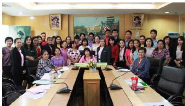
การประชุมเชิงปฏิบัติการกำกับ ติดตามผลการปฏิบัติราชการและจัดทำรายงานผลการดำเนินงานตามคำรับรองการปฏิบัติราชการ รอบ 9 เดือน ของสำนักงาน ก.ค.ศ. ประจำปีงบประมาณ พ.ศ. 2559 ณ ห้องประชุมอภัย จันทวิมล อาคารเสมารักษ์ กระทรวงศึกษาธิการ เมื่อวันที่ 12 กรกฎาคม 2559