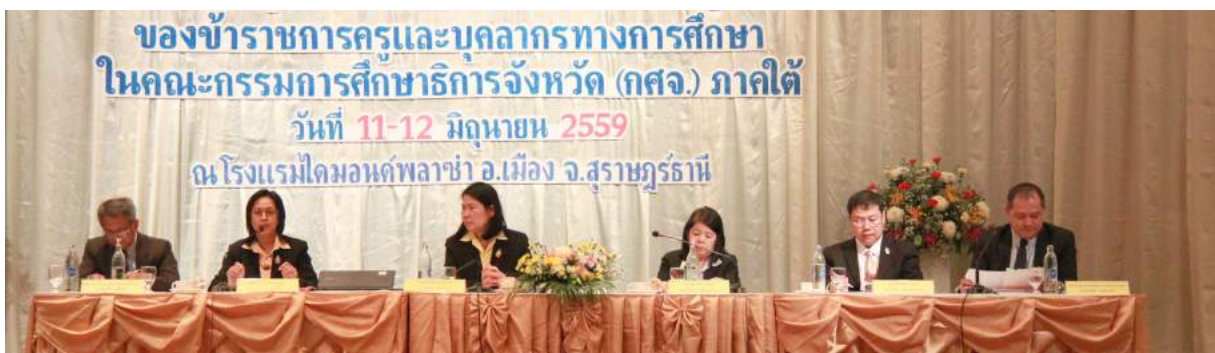
การประชุมสัมมนาการบริหารงานบุคคลของข้าราชการครูและบุคลากรทางการศึกษาในคณะกรรมการศึกษาธิการจังหวัด (กศจ.) ครั้งที่ 3 ภาคใต้ ณ โรงแรมไดมอนด์พลาซ่า อ.เมือง จ.สุราษฎร์ธานี เมื่อวันที่ 11 - 12 มิถุนายน 2559