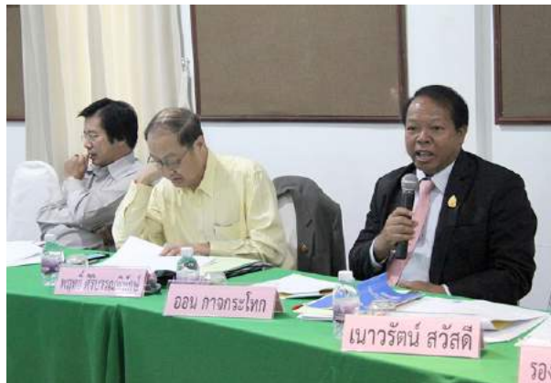
ประชุมเชิงปฏิบัติการพัฒนาหลักสูตรและวิธีการเตรียมความพร้อมและพัฒนาอย่างเข้ม ตำแหน่งครูผู้ช่วย ณ บ้านทิพย์สวนทองรีสอร์ท จังหวัดสมุทรสงคราม เมื่อวันที่ 22 - 24 พฤศจิกายน 2558