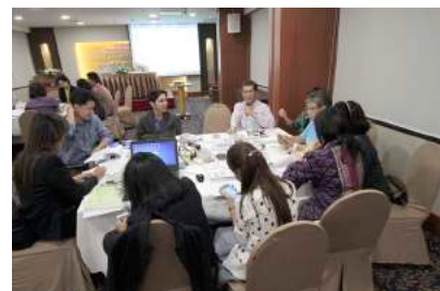
การประชุมเชิงปฏิบัติการกำหนดขั้นตอนและระยะเวลาการปฏิบัติงานของสำนักงาน ก.ค.ศ. เมื่อวันที่ 12 - 14 พฤษภาคม 2559