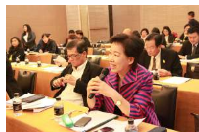
การประชุมเชิงปฏิบัติการจัดทำ (ร่าง) หลักเกณฑ์และวิธีการเกี่ยวกับการบริหารงานบุคคลของตำแหน่งบุคลากรทางการศึกษาอื่นตามมาตรา 38 ค. (2) ณ โรงแรมไมด้า จามวงค์วาน กรุงเทพมหานคร เมื่อวันที่ 30 พ.ค. - 1 มิ.ย. 2559