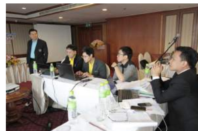
การประชุมเชิงปฏิบัติการ การดำเนินโครงการ ก.พ. 7 อีเลกทรอนิกส์ ณ โรงแรมปรีทิวาเลซ มหานคร เมื่อวันที่ 11 - 13 กรกฎาคม 2559