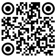
แบบฟอร์มใบรับรองแพทย์

QR Code แบบฟอร์มต่าง ๆ สำหรับการรายงานตัวและบรรจุเข้ารับราชการ