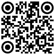
ใบรับรองแพทย์

QR Code แบบฟอร์มต่าง ๆ สำหรับการรายงานตัวและบรรจุเข้ารับราชการ