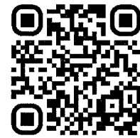
ตัวอย่างหนังสือรับรองประสบการณ์การทำงาน