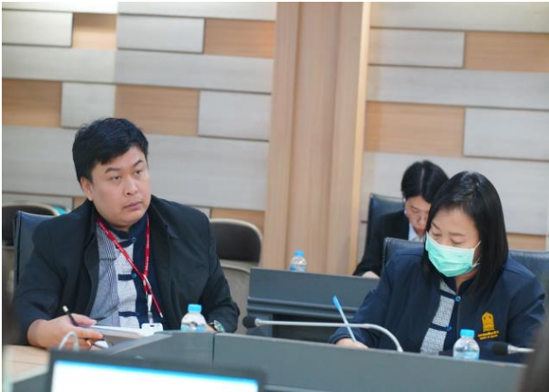
ภาพที่ ๓ การทบทวนและวิเคราะห์ผลกระทบทางลบต่อสังคม ของสำนักงาน ก.ค.ศ. ประจำปีงบประมาณ พ.ศ. ๒๕๖๘