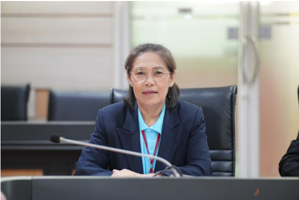
ภาพที่ ๒ คณะทำงานจัดทำแผนการจัดการผลกระทบทางลบต่อสังคมของสำนักงาน ก.ค.ศ. ประจำปีงบประมาณ พ.ศ. ๒๕๖๘